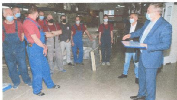
Во время встречи с коллективом мебельной компании «Артим» выразил благодарность за оказанную помощь врачам во время пандемии.