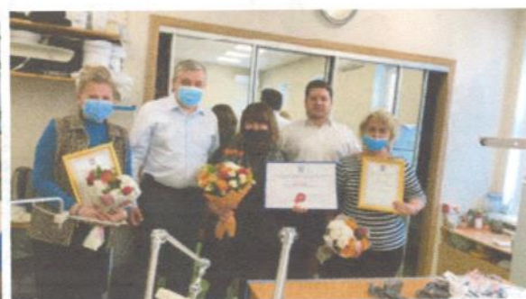
За работу в пандемию выразил благодарность сотрудникам мытищинских организаций «ИНТЕРСЭН-плюс» и ООО «ИЗИДА»