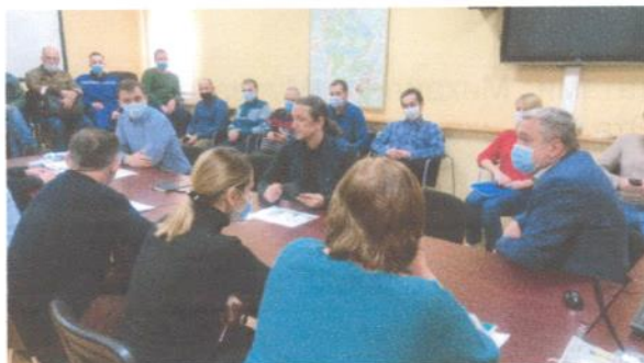
Встреча с трудовым коллективом в Мытищинской Теплосети.