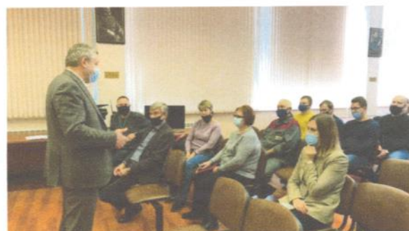
Встреча на ОАО "Мытищинский машиностроительный завод". В ходе рабочей встречи обсудили текущие вопросы.